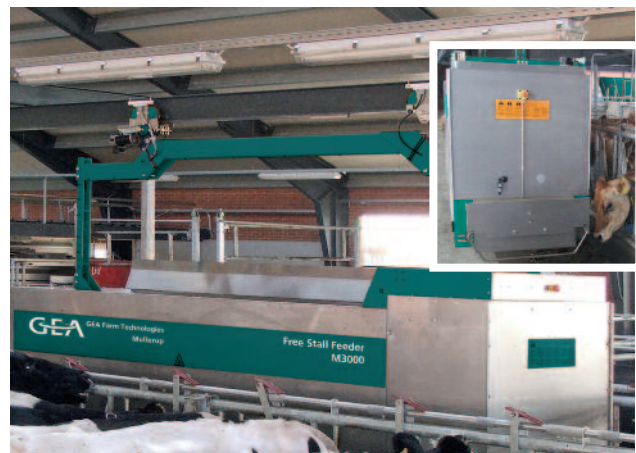
Fleißiger Energielieferant: Der computergesteuerte, batteriebetriebene Futterwagen serviert das Kraftfutter gruppenweise.