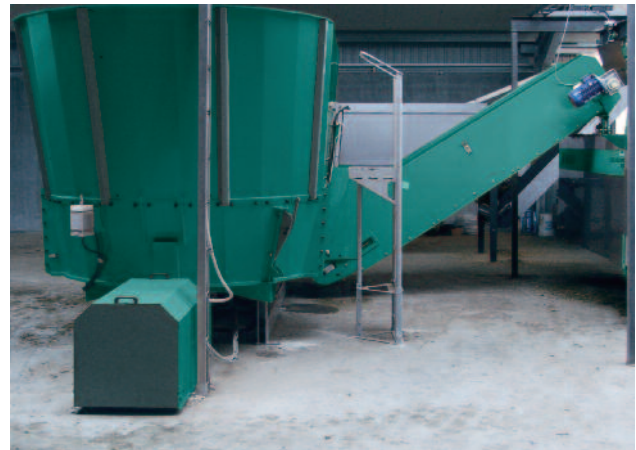
Minimaler Arbeitseinsatz für das Füllen des Kraftfuttermischers (z. B. MVM Vertikalmischer, 6,5 – 30 m 3 ).