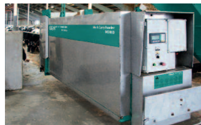
Saubere Tatsachen: Frei schwebende Futterausgabe über dem Futtertisch

Mit individuellen Rezepturen servieren Sie jeder Tiergruppe einen Speiseplan nach Wunsch. Den schnellen Zugriff auf Futterpläne, Komponenten, Mengen oder Vorlagevorgaben bietet die nutzerfreundliche WIC-Steuerung. Einmal gestartet, managt Mix & Carry das Einwiegen, Mischen und Austeilen mittels Futterwagen ganz allein. Selbstverständlich nicht, ohne Ihnen bis in jedes Detail davon zu berichten: Über intensives Herdenmanagement, für das Ihnen Mix & Carry dank der Arbeitsentlastung nun ein Vielfaches an Zeit schenkt, können Sie exakt die Wirkung Ihres Konzepts verfolgen und für den langfristigen Erfolg optimieren.