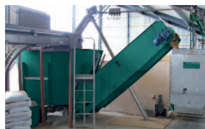
Frische Energie: Für hochwertiges Kraftfutter arbeiten Mischer und Feeder Hand in Hand

Lauffreudig, aber dabei leise und immer gewissenhaft verteilt der batteriebetriebene Futterwagen die korrekten TMR-Rationen an die verschiedenen Leistungsgruppen. Die schienengeführte Aufhängung lässt ihn frei über den Futtertischen schweben, während er präzise ein- oder beidseitig über einen Querförderer austeilt. Seine Bauweise macht den Feeder extrem flexibel. Ganze 2m Breite reichen aus, um beispielsweise Futtertische in älteren Gebäuden zu bedienen. Für den Stallneubau bietet das schlanke System eine Menge Platzersparnis. Steigern Sie auch auf kleiner Fläche die Produktivität!