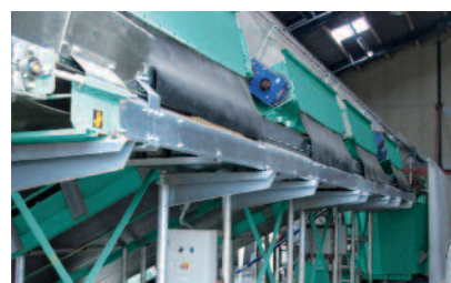
Produktiver Feeder – ein neuer Stallgenosse, den die Tiere absolut gerne akzeptieren