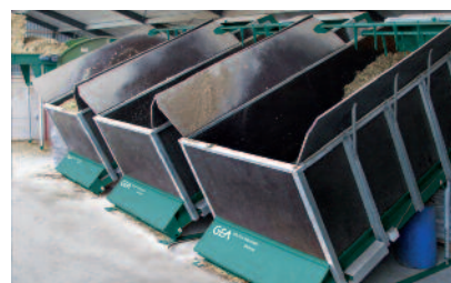
Geräumige Kapazitäten: Minimaler Arbeitsaufwand für das bedarfsweise Füllen der Magazine

Mix & Carry reduziert die Arbeit allein auf das gelegentliche Füllen der Magazine und Silos. Das häufige Austeilen bei entspannter Ruhe verbessert die Futteraufnahme und ebenso die anschließende Futterverwertung. Der stets neue Ansatz hält das Futter immer frisch und frei von Fermentationsprozessen. Die energiereiche Kost lassen sich die Tiere restlos schmecken, denn am Futtertisch sprechen die sauberen Tatsachen für sich: Ihre gesund ernährten Kühe werden Ihnen dies mit bester Qualitätsmilch danken!