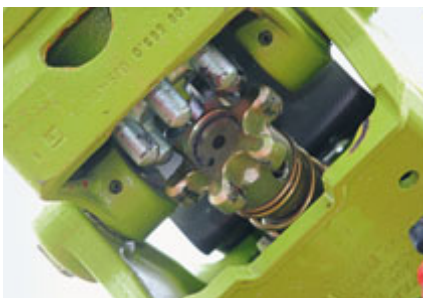
Die Fingerkupplungen sind jederzeit kraftschlüssig. Außerdem sind sie — wie auch die Kreiselantriebe — wartungsfrei.

soll. Außerdem verspricht Claas mit dieser Zinkenordnung eine bessere Querverteilung bei einem höheren Durchsatz.