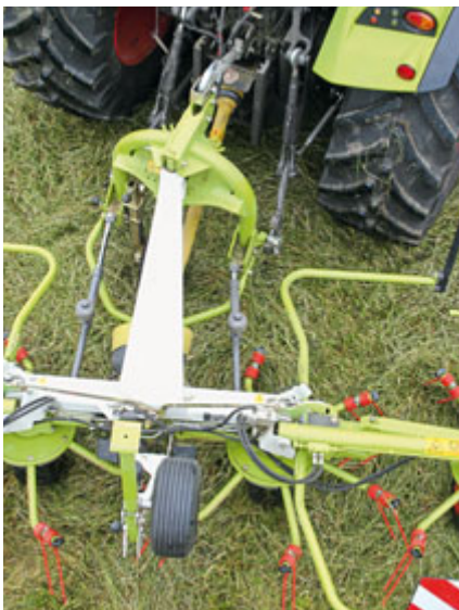
Hydropneumatisch wird die Maschine mit den beiden Zylindern stabilisiert. Das funktioniert gut.