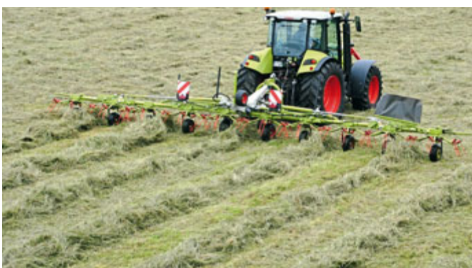
Für heuerbende Betriebe dürfte das Nachtschwadgetriebe interessant sein. Damit wird die Kreiseldrehzahl um rund zwei Drittel reduziert.

Dabei ist das Konzept mit den hydraulischen Stabilisatoren und den tangential montierten Zinkenarmen überzeugend. Wer sich einen solchen Wender zulegen möchte, der muss natürlich wissen, dass die Maschine mit 1500 kg nicht für kleinere Schlepper geeignet ist. Hier bietet sich die gezogene T-Variante von Claas an. Außerdem ist die Aushubhöhe der Ausleger am Vorgewende gering. Trotzdem machte der Volto unter unseren Bedingungen hinsichtlich Futterverteilung und Rechqualität eine gute Figur.