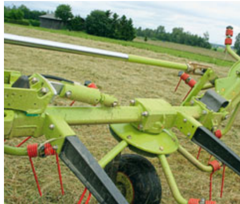
Trotz des kleinen Zusatzzylinders, der die äußeren drei Kreisel aushebt (rechtes Bild), ist die Aushubhöhe am Vorgewende gering.