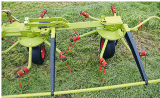
Die Zinken verfügen über eine Verlustsicherung. Die Träger für den Schutz sind aus glasfaserverstärktem Polyamid gefertigt.