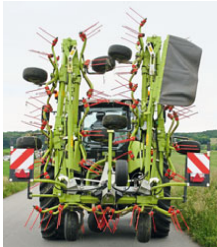
Zusammengeklappt ist der Wender 3 m breit, 3,80 m hoch und 1 500 kg schwer.

mit dem optionalen Tastrad am Dreipunktbock (363 Euro, alle Preise ohne Mehrwertsteuer) ausgerüstet. Das ist beim Anbau hilfreich, weil dann eine Oberlenkerwippe geliefert wird, die ähnlich wie ein Langloch während der Arbeit frei beweglich ist. Damit kann der Oberlenker einfach gekuppelt werden. Die Gelenkwelle braucht kein Weitwinkelgelenk und dreht während der